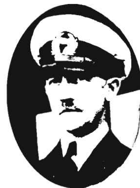
Kapitän Gustav Schröder

Schröder auf dem Wendepunkt der Geschichte in seinem Tagebuch wie folgt vermerkt hat: „Die einzigen, die in all den schweren Tagen unbekümmert blieben, waren die Kinder der Passagiere, sie freuten sich, länger an Bord bleiben zu können und nahmen ihr Schicksal höchstens spielerisch wichtig, indem sie ein Spiel erfanden mit dem Namen ‚Juden haben keinen Zutritt‘... Leider war es nicht ein Traum, daß ich mit neuhundert verzweifelten Passagieren, die kein Land auf der ganzen Welt aufnehmen wollte, mitten auf dem Atlantik herum fuhr. Und ich empfand ein Unbehagen, als mir klar wurde, daß ich die Disziplin nicht mehr mit der Hoffnung auf eine Landung im Westen aufrecht erhalten konnte. Ich hatte jetzt die traurige Pflicht, meinen Passagieren reinen Wein einzuschenken über die Aussichtslosigkeit einer Landung in Amerika ...“.